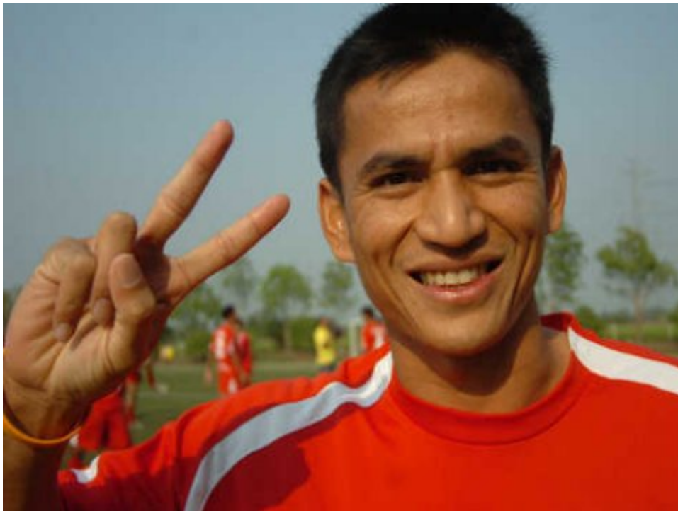
• ภาพประกอบข่าว

คมชัดลึก : ในระยะนี้มีเสียงพูดกันอยู่บ่อยๆ ว่า ประเทศไทยถูกเวียดนามแซงหน้าไปแล้วในเรื่องเศรษฐกิจ การค้า และการลงทุน หรืออีกไม่นานเราคงจะล่าหลังกว่าเวียดนาม ซึ่งคำพูดทำนองนี้ได้ก่อให้เกิดโรค "กลัวเวียดนาม" ขึ้นมาในจิตใจของคนไทยจำนวนไม่น้อย