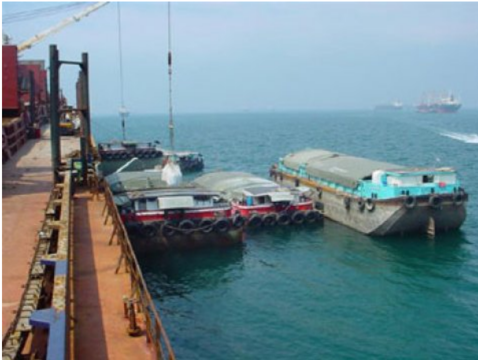
ภาพประกอบข่าว

คมชัดลึก : ผมเขียนต้นฉบับ "วันเว้นวัน" ฉบับนี้ที่ปลายแหลมมลายู มองจากหน้าต่างห้องพักที่โรงแรมฮอลิเดย์อินน์ออกไป จะเห็นท้องทะเลช่องแคบมะละกา ซึ่งอยู่ระหว่างเมืองมะละกากับเกาะสุมาตรา ช่องแคบแห่งนี้มีความยาวประมาณ 600 ไมล์