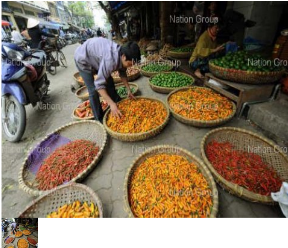
• ภาพประกอบข่าว

คมชัดลึก : ผมกลับมาเยือนसानอยอีกครั้งหลังจากเวลาผ่านไป 6-7 ปี แม้ว่าสภาพโดยทั่วไปจะไม่แปลกตาไปจากเดิมมากนัก ไม่ว่าจะเป็นอาคารเก่าๆ การแต่งกายของผู้คน หรือร้านเฟลอ ร้านน้ำชาข้างถนน ที่เนืองแน่นไปด้วยลูกค้าที่ลอมวงรับประทานอาหาร