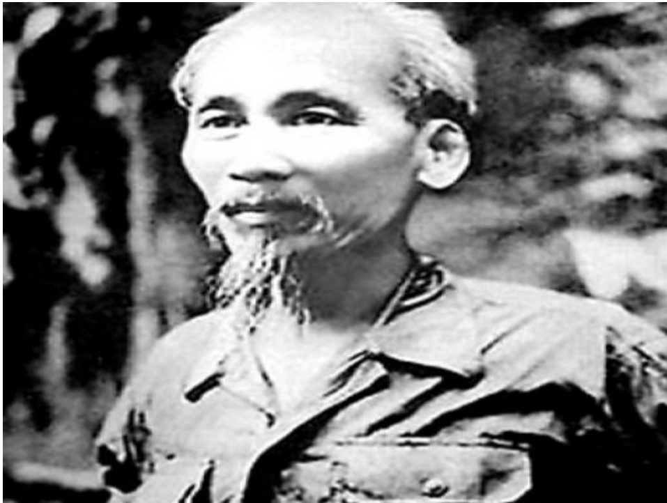
• ภาพประกอบข่าว

คมชัดลึก :วันที่ 2 กันยายน ปีนี้ เป็นวันครบรอบ 65 ปี แห่งการประกาศเอกราชของเวียดนาม นับจากวันที่ญี่ปุ่นพ่ายแพ้ในสงครามมหาเอเชียบูรพา และโฮจิมินห์ฉวยโอกาสแยกเวียดนามเป็นอิสระจากอินโดจีนของฝรั่งเศส แต่เอกราชของเวียดนามก็ไม่ได้มาด้วยความราบรื่น เพราะหลังสงครามโลกครั้งที่สอง ฝรั่งเศสได้หวนกลับมายึดครองเวียดนามใหม่