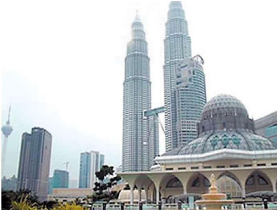
ภาพประกอบข่าว

คมชัดลึก : มีคนบอกกับผมว่ามาเลเซียเป็นชาติที่มีประวัติศาสตร์สั้นและมีปัญหาในเรื่องการหาสิ่งที่จะแสดงความเป็นเอกลักษณ์ของตนเอง การมีประวัติศาสตร์สั้นนั้นไม่ได้มาจากการที่เพิ่งสถาปนาประเทศมาเลเซียเมื่อ พ.ศ.2506 หรือเมื่อ 47 ปีที่แล้ว